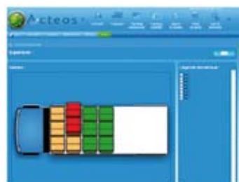
Interfaces web 2