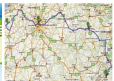
Optimisation de tournées